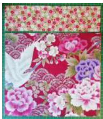
« Extérieur »

Assembler et épingler les coupons « Extérieur » endroit contre endroit et coudre sur 1cm du bord. Faire la même chose les coupons « Doublure »