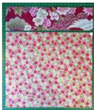
« Doublure »